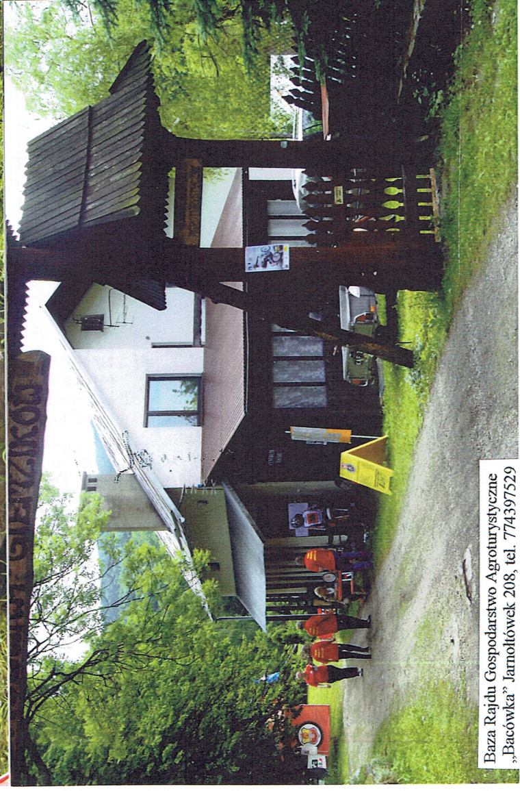
Baza Rajdu Gospodarstwo Agroturystyczne „Bacówka” Jaroltówek 208, tel. 774397529